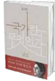
• «ما الوطن؟» • يوشي مين

تكونت الدراسة من ستة فصول. تناول الفصل الأول التصحر كمشكلة عالمية حيث ناقش أسبابه والقضايا المتصلة به مثل تأثير الاحتباس الحراري، والبيوت الحرارية، وتغير المناخ العالمي، وثاني أكسيد الكربون، ودور الإنسان نفسه، وإزالة الغابات، والرعي الجائر المصاحب لزيادة الثروة الحيوانية. وتناول الفصل الثاني نطاق مشكلة الدراسة وأهدافها وبيئتها. كما تعرض لوصف المنطقة الجنوبية من عمان من حيث تضاريسها، وبيئتها، وبيئتها، وبيئتها، وبيئتها. وتناول الفصل الثالث السكان في عمان وأنشطتهم الزراعية، وتربية الماشية ونظامها في البادية، والحضر، والجبال. وتناول الفصل الرابع إمكانيات الرعي في عمان وناقش على وجه التحديد نظام الرعي في شمال عمان، ووسطها، وجنوبها. كما تعرض للعوامل التي تسببت في تدهور المراعي في المنطقة الجنوبية، ومنها توقف نظام الرعي الدوراني التقليدي، وتوقف ممارسة الرعي في المناطق المملوكة والحقوق المرتبطة بها، والحطاب، وحدوث الجفاف الطبيعي. وتناول الفصل الخامس جهود الحكومة في الحفاظ على البيئة، ومنها جهود مكتب مستشار جلالة السلطان لشؤون البيئة، ومجلس حفظ البيئة، ووزارة البيئة وموارد المياه. وتناول الفصل الأخير التوصيات والخاتمة. ويرى الباحث أن توصيات الدراسة يمكن أن تثمر إذا توفر لها أمران أولهما، الاعتراف بوجود المشكلة من قبل كل من الحكومة وأهل المنطقة، ورغبة كليهما في علاجها. وثانيهما، إنشاء هيئة حكومية لتنسيق جميع جوانب التنمية في المنطقة وتنفيذ توصيات الدراسة.