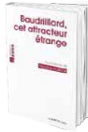
• «بودريار هذا الجذاب الغريب» • مؤلف جماعي