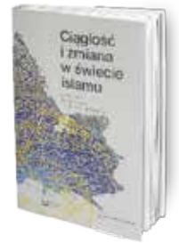
• «الاستمرارية والتغير في عالم الإسلام» • عدة مؤلفين