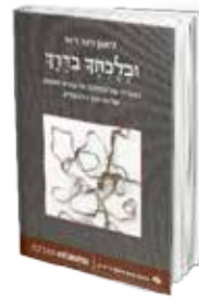
• «وحيث تمشي في الطريق» • ليون فينر دوف