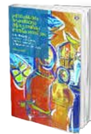
• «الرسالة وعلم الطبيعيات» • فيصي