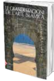
• «الأطوار الكبرى للفن الإسلامي» • جوهاني كورا تولا