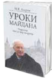
• «دروس الميدان» • نيكولاي أزاروف