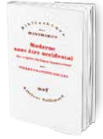
• «حديث دون أن يكون غربياً» • بيار فرنسو سويري