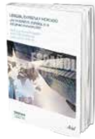
• «القيمة الاقتصادية للغة الإسبانية» • عدة مؤلفين