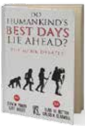
• «هل الأيام القادمة أفضل أيام البشرية؟» • عدة مؤلفين