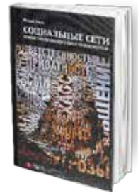
• «واقع التواصل الاجتماعي» • مارييا فيل