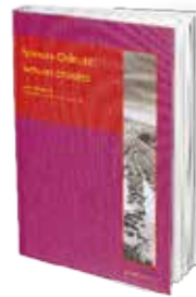
• «سبينوزا ودولون» • عدة مؤلفين