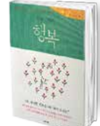
• «السعادة» • بوب نيون