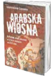
• «الربيع العربي» • عدة مؤلفين