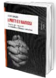
• «رهبان الكنيسة وأباطرة المافيا» • إيسايا سألز