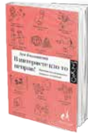
• «ثمة مخطنون في الإنترنت» • آسيا كازانتسيفا