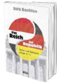
• «من الإمبراطورية إلى الجمهورية» • ديريك روختوس