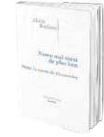
• «داؤنا يأتينا من بعيد» • آلان باديو