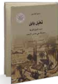
• «تخيل بابل» • ماريو ليضرائي