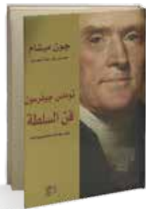
• «توماس جيفرسون فن السلطة» • جون ميشام