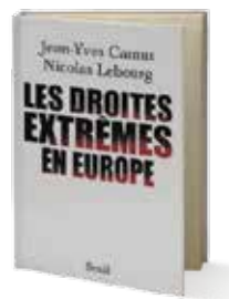
• «تيارات اليمين المتطرف في أوروبا» • جان بييف كامو ونيكولا ليبورج