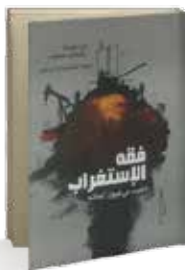
• «فقه الاستغراب» • ابن بوروما وأفيشاي مارغاليت