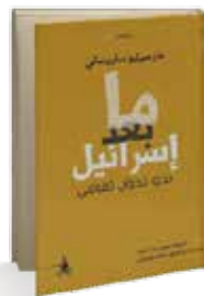
• «ما بعد إسرائيل - نحو تحول ثقافي» • سعيد بوكرامي