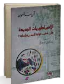
• «الإمبراطوريات الجديدة» • آن سأمون